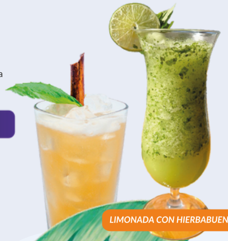
LIMONADA CON HIERBABUENA