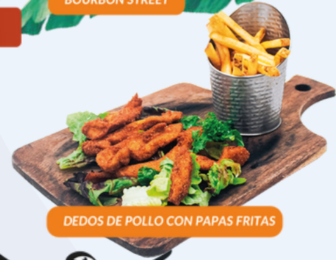
DEDOS DE POLLO CON PAPAS FRITAS