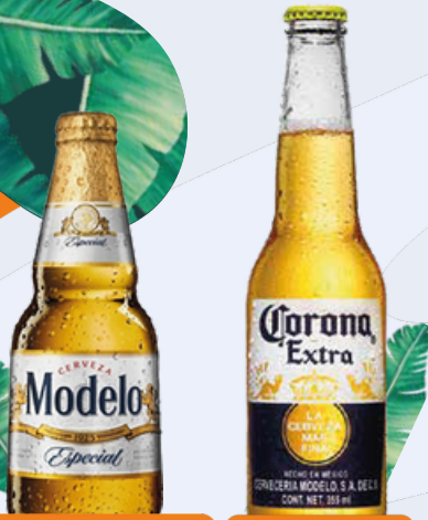
CERVEZA MODELO ESPECIAL